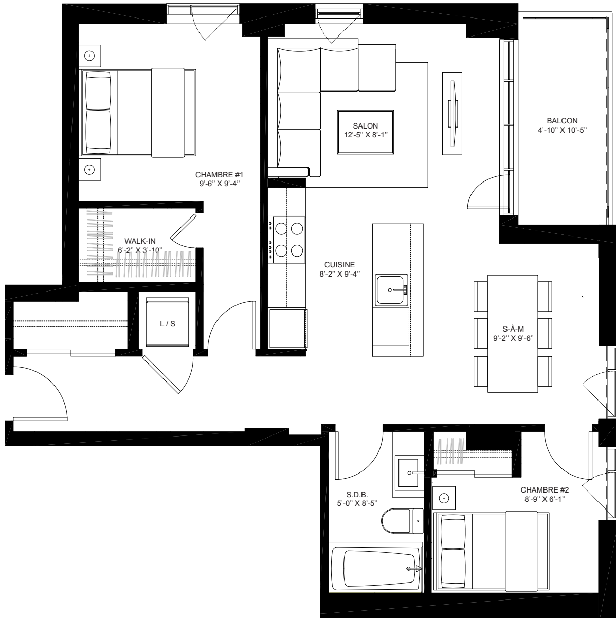
Échelle: 3/16" = 1'-0"