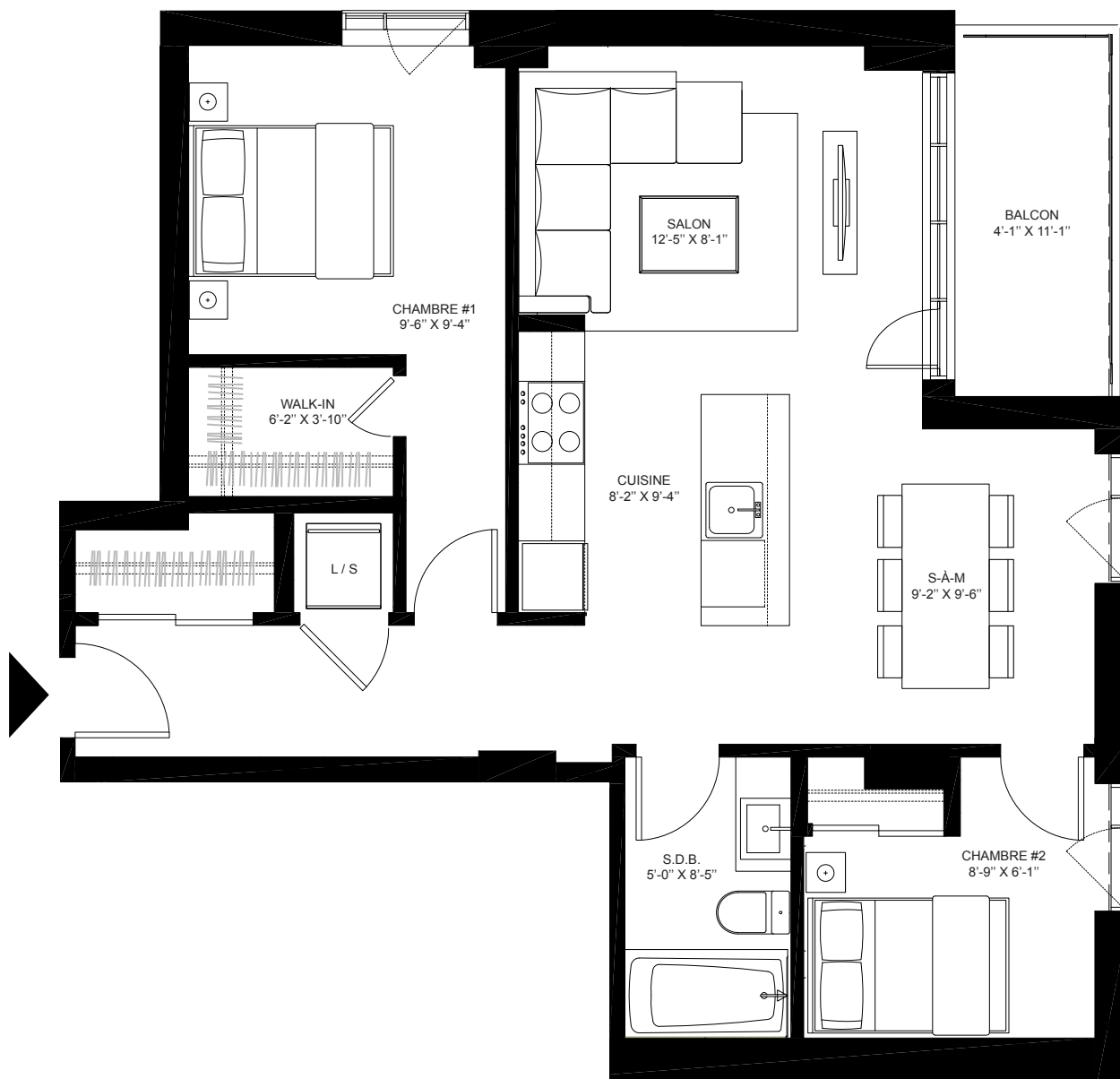
Échelle: 3/16" = 1'-0"